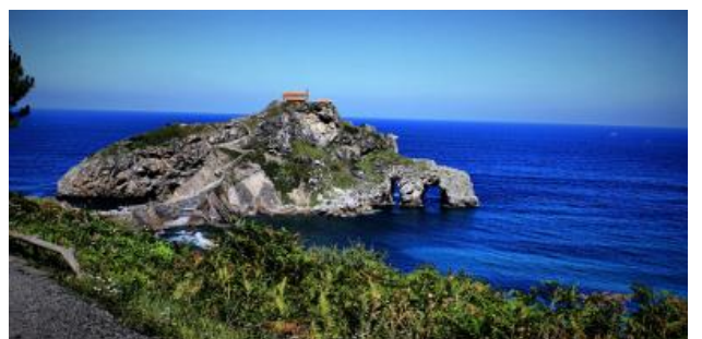
Paisaje en Euskadi