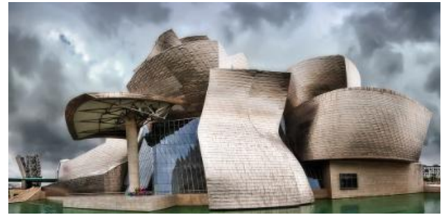
Museo Guggenheim Bilbao