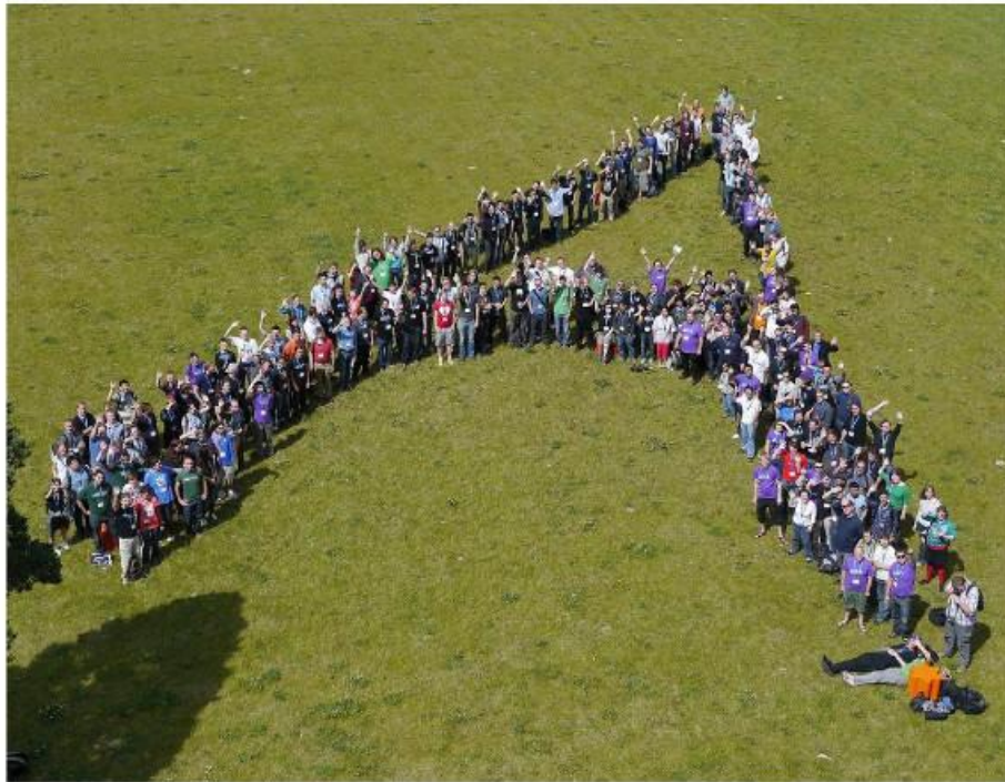
Akademy 2012, Tallinn, Estonia